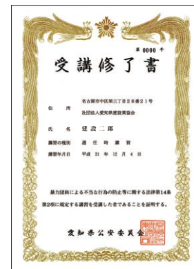
不当要求防止責任者講習受講修了証

対応は原則自社事務所内で行い、やむを得ず自社事務所外の場合は、相手の指定する場所は断り、必ず複数の社員で赴くことが大切です。