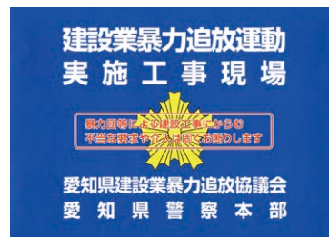
暴力追放運動実施現場ステッカー

相手方をけん制するため「暴力追放ポスター」、「不当要求防止責任者講習受講修了証」、「責任者ステッカー」、「暴力追放運動実施現場ステッカー」を掲示しておきましょう。