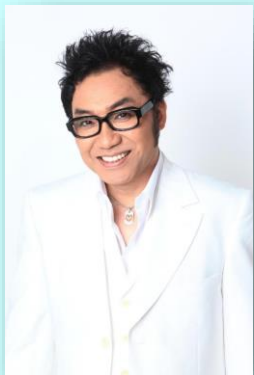
ものまねタレント 「コロツケ」さん