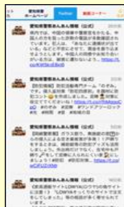
ツイッター (あんあん情報)