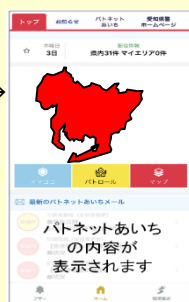
パトネットあいち (地図上で確認可)