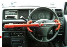
ハンドル固定装置