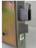
鎌状デットボルト