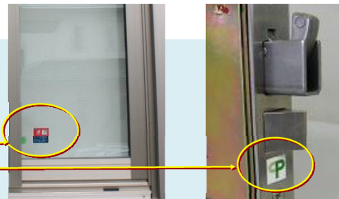
堅牢なCP建物部品を活用