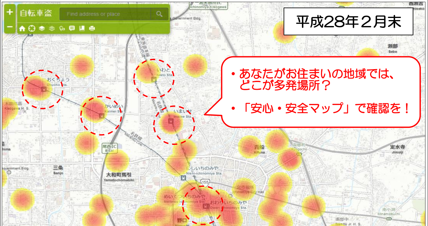
被害の場所（県内：2月末）