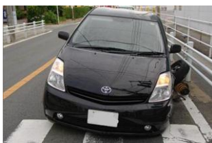
他の犯罪に使用され、事故を起こし放置された盗難車...