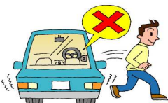
名古屋市内における自動車盗月別発生状況

また、警報装置やハンドル固定装置の活用など、複数の防犯対策を組み合わせることが重要です。