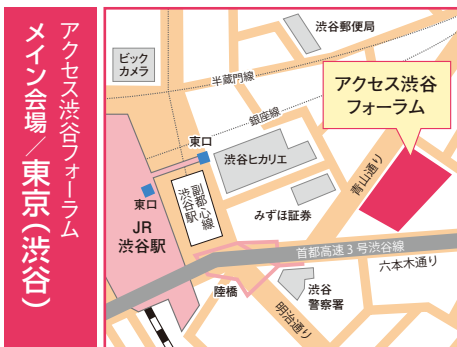
東京都渋谷区渋谷2-15-1 渋谷クロスタワー24階 JR「渋谷」駅、東口より徒歩3分

※講習の趣旨等の詳細については、当センターホームページごらんください。URLは裏面に記載しております。