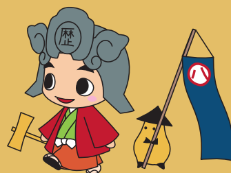
歴まちくんとおとも 歴まちくんは名古屋市歴まちづくりのPRキャラクターです

申込方法：裏面申込先へ Fax または E メールにてお申込ください 申込締切：平成 24 年 11 月 16 日 (金)