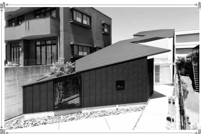
第23回受賞作品 抜粋