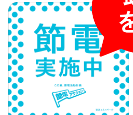
節電宣言ステッカー