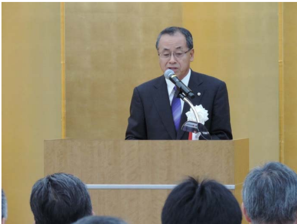
（全建近藤会長挨拶）