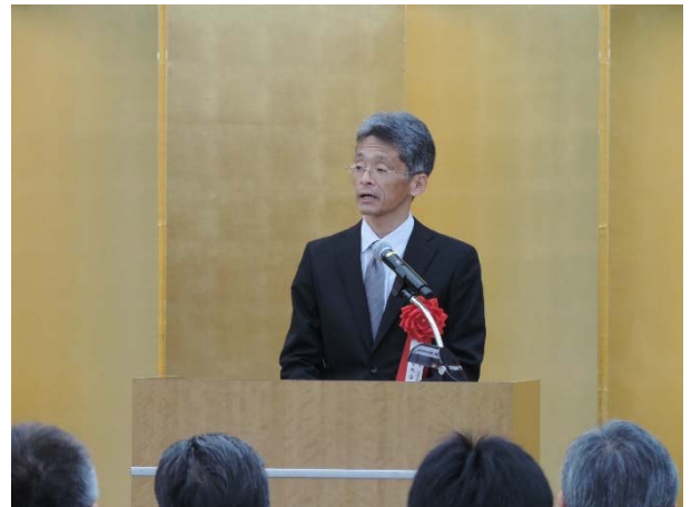
（青木建設流通政策審議官挨拶）